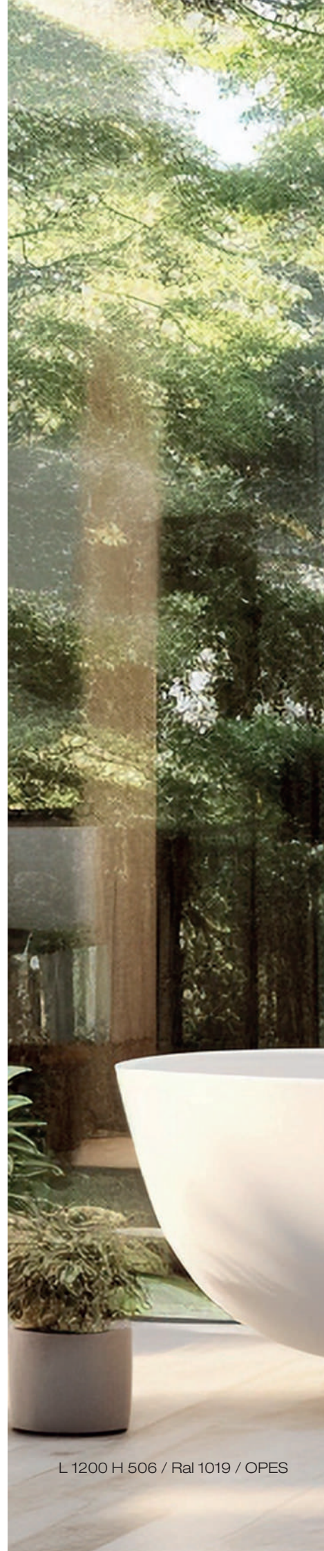
L 1200 H 506 / Ral 1019 / OPES